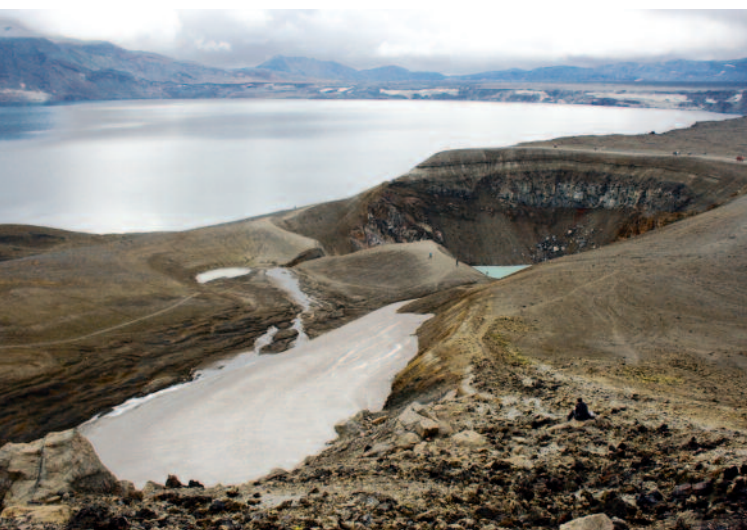
Figure 1. L'Askja avec une vue sur la caldeira d'Öskjuvatn et son lac (gauche) et le cratère Viti, tous les deux formés lors de l'éruption plinienne de 1875. Photo de juillet 2010.

Ainsi, l'objectif principal du projet dans le cadre de la bourse L.A.V.E. est d'effectuer une mission de terrain de deux semaines afin d'effec-