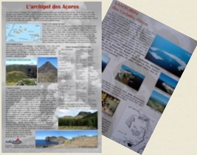
Deux exemples de panneaux de l'exposition : «Santorin», et «l'archipel des Açores».

Outre les douze panneaux, divers éléments sont proposés qui permettent d'enrichir l'exposition. Un DVD d'images réalisées par les adhérents de l'association sur les volcans du monde entier l'illustre de façon spectaculaire. Nous proposons également des compléments :