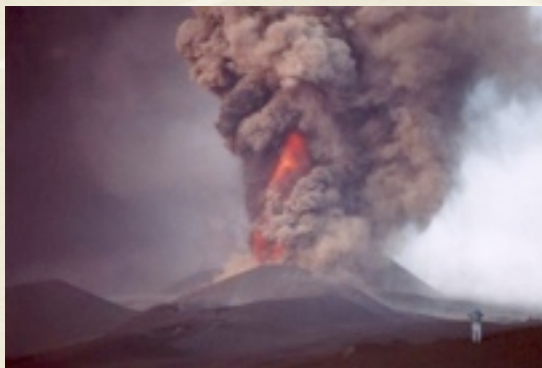
Etna, Italie.

Un film, montage d'images réalisées par les adhérents de l'association, l'illustre de façon vivante et spectaculaire.