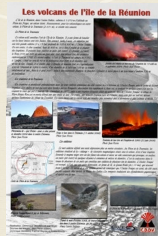
L'exposition aborde aussi les volcans français d'outremer, comme ceux de la Réunion.

UNE EXPOSITION DE L'ASSOCIATION VOLCANOLOGIQUE EUROPÉENNE