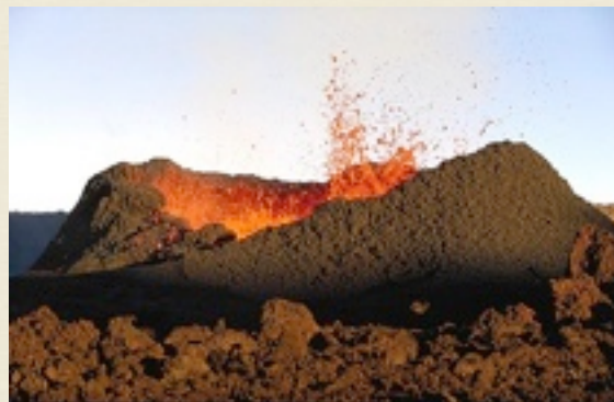
Éruption sur le Piton de la Fournaise, La Réunion.